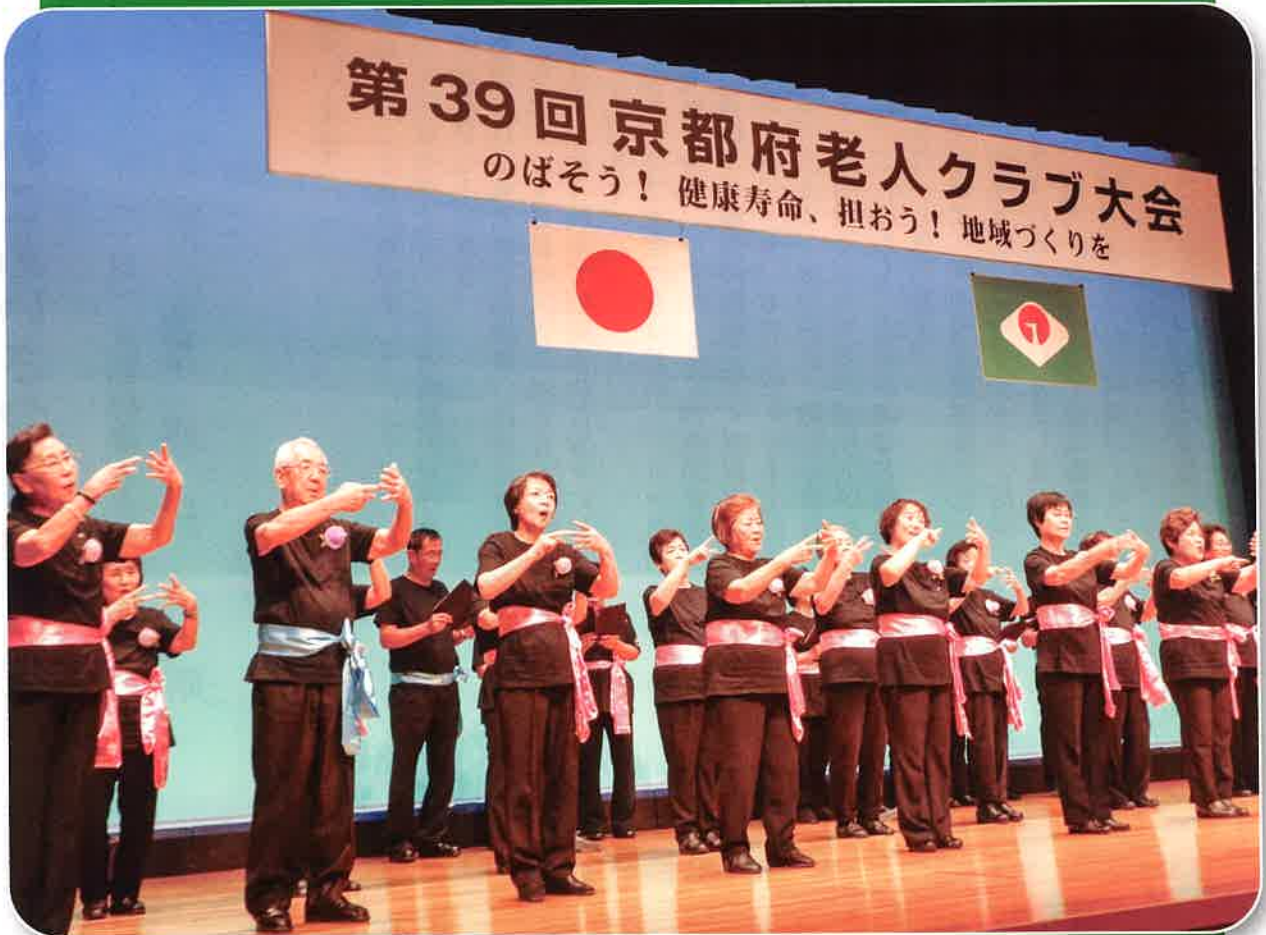
八幡市老連による活動発表「手話コーラス」