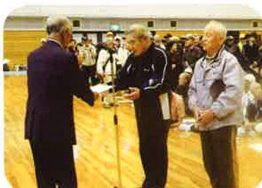
団体の部 優勝 宇治Aチーム