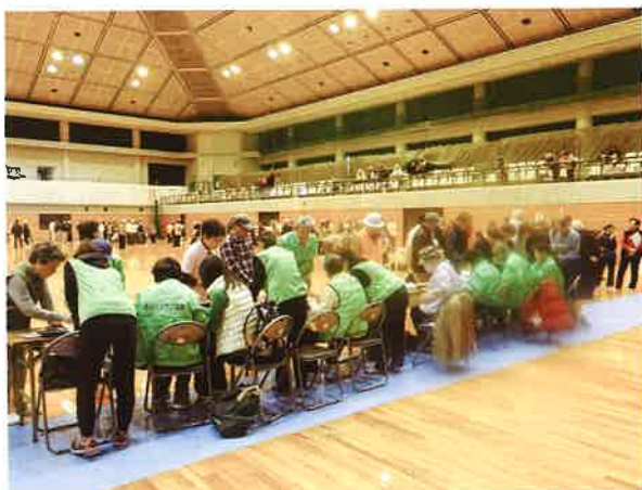
若手委員スタッフによる受付・集計

昨年度の公式ワナゲブロック別大会に続き、今年度は11月16日に八幡市民体育館で「京都府大会」が開催されました。当日は、72チーム360人の選手と役員や応援、計410名が参加し、大きな声援の中、熱戦が繰り広げられました。