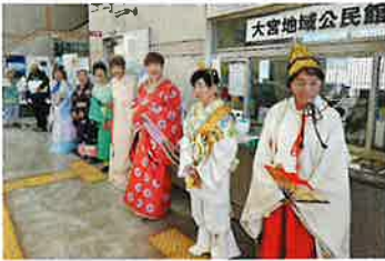
丹後七姫のお出迎え