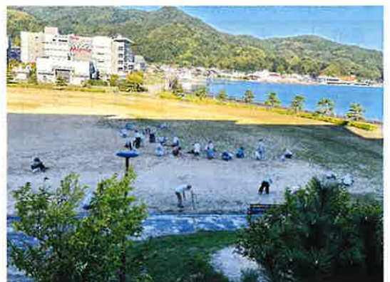
島崎公園除草作業の様子

9月20日は「社会奉仕の日」ということで、宮津市老人クラブでは一斉清掃を行っています。昨年もたくさんの方に参加していただき、島崎公園をはじめ、各地で清掃活動を行っていただきました。