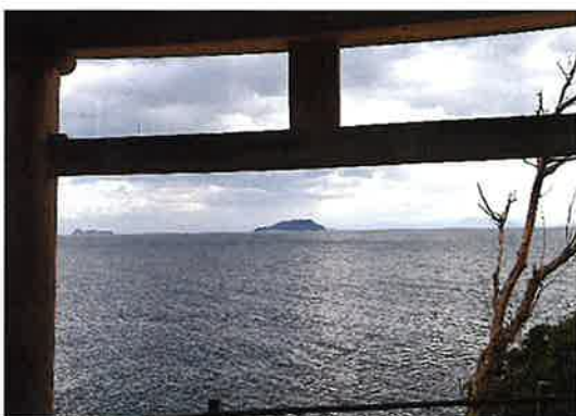
新井崎神社からの冠島

神社、冠島に近い新井崎、伊根の舟屋の郷公園等の海岸道路を走りました。 機会があれば忘れかけられた丹後縦貫林道を思い出し出してください。一度走ってみてください。