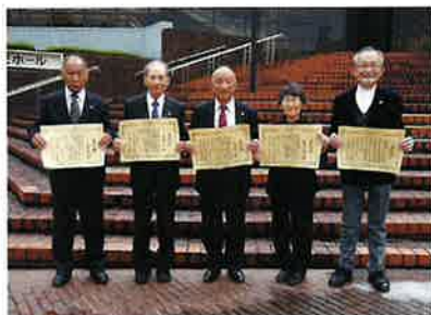
全老連会長育成功労表彰受賞者

しっかり食べてフレイル予防することが健康寿命を延伸するカギになると言われていました。