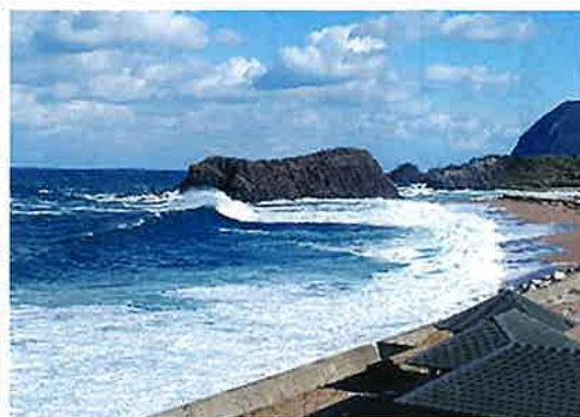
荒波打ちよせる立岩