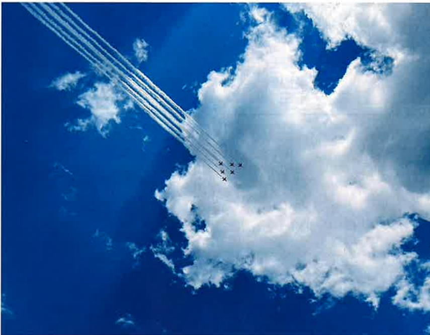
宮津市制70周年記念で天橋立上空を展示飛行するブルーインパルス

これ等を受けて、老人会は、地域の高齢者の仲間づくりと人と人とのつながりを大切に孤独・孤立の防止、認知症の正しい知識と理解の普及に向