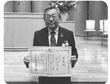
知事賞 松栄会(栄3.4丁目)