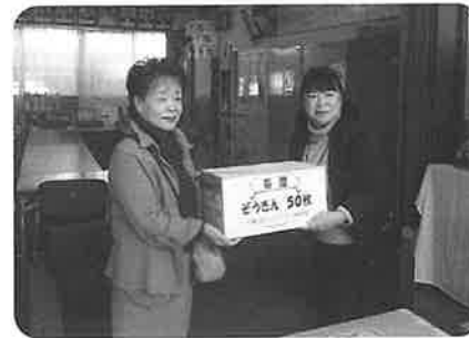
小学校へ雑巾寄贈