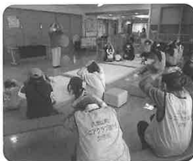
あいあいホール交流会