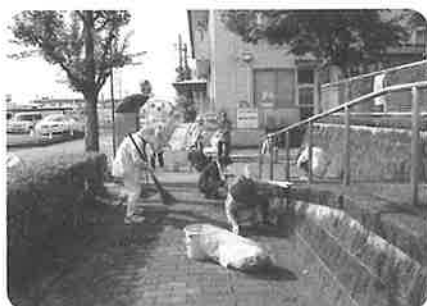
各委員会合同清掃奉仕活動