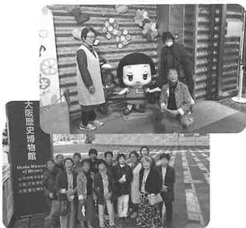
女性委員会社会見学