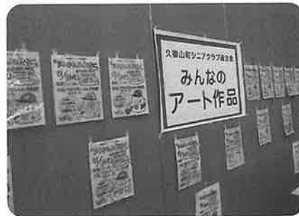
みんなのアート作品 (塗り絵)