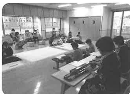
大正琴発表 あいあいホール