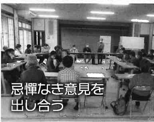
忌憚なき意見を出し合う

出席役員の提案で、喜老会の会員が減少しているので、出席者・女性部役員の全員に、今後の参考として、原点到返って、喜老会に入られた動機や理由、また入ってよかった事、悪かった事について、お話を聞かせていただきました。さまざま動機や理由があり、また、入ってよかったという意見が大半でした。今後の会員増強に生かしていきたいと思ひます。 お手伝いをいただいた役員の方、参加された女性部長の皆さまお疲れさまでした。