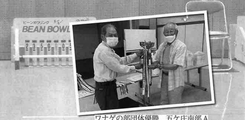
ワナゲの部団体優勝 五ヶ庄南部 A