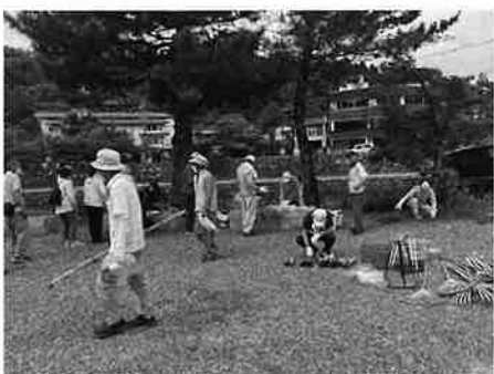
清掃活動日和でした

日和であったのか、日曜日でお忙しいにも拘らず、82名の宇治連合喜老会の方々が社会奉仕活動に参加していただきました。皆さまには梅雨の暑さにめげず、鎌を用い、竹ぼうき、熊手を使って遅く夏草雑草除去に励まれて、76個のゴミ袋を出す事ができました。