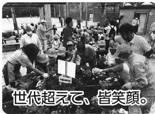
世代を超えて、皆笑顔。

葉を述べてくれて、みんなが「ありがとうございます!」と声をそろえてくれました。公園から帰るときはお互いに笑顔で手を振ってお別れしました。何と云う幸せに満ちた時間だったでしょう。喜老会の理念である「健康、友愛、奉仕」の実践の1つの新しい形でした。