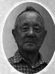
宇治市連合喜老会