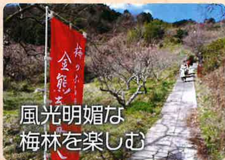
風光明媚な梅林を楽しむ

①まず東大阪市にある金熊寺梅林です。私達を待っていたかのようにちよつと3分から5分咲きの白花。明日、明日咲くであろうこの梅林をガイドさんの先導で約45分一周りました。地元の受け入れは素朴なおばあさんおじいさん達で、手作りの漬物、草餅、古代米、昔伝来の梅干し等も売店で買うことができました。