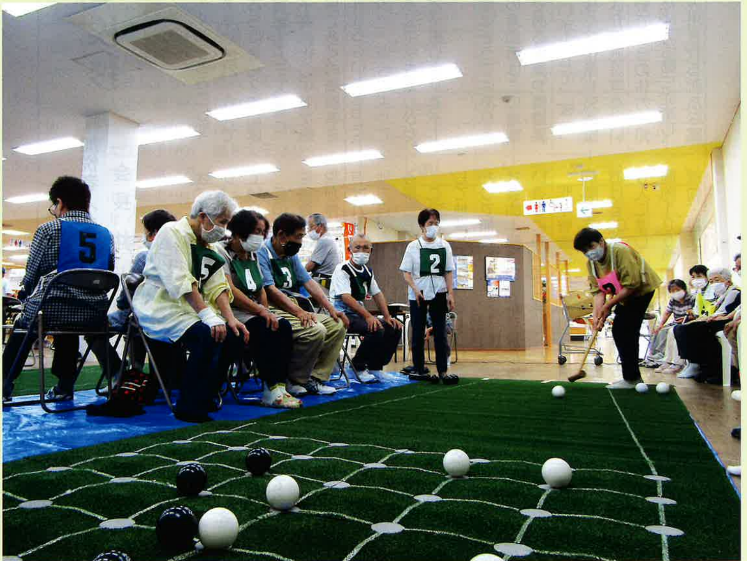
ショッピングセンター「ウイル」でプレーを楽しむ