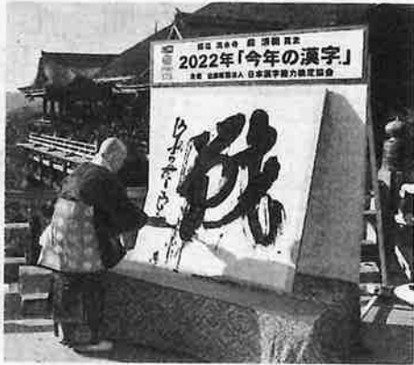
今年の漢字一文字