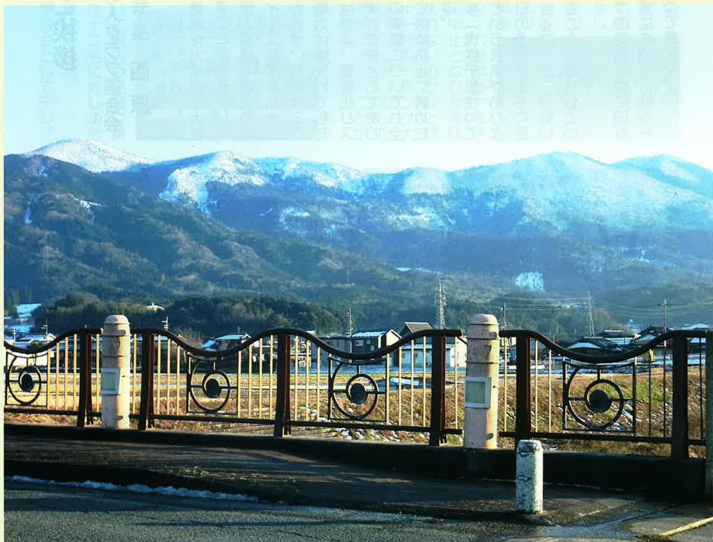
加悦「はにわ橋」より大江山連峰を望む