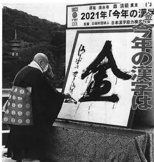
今年の漢字一文字